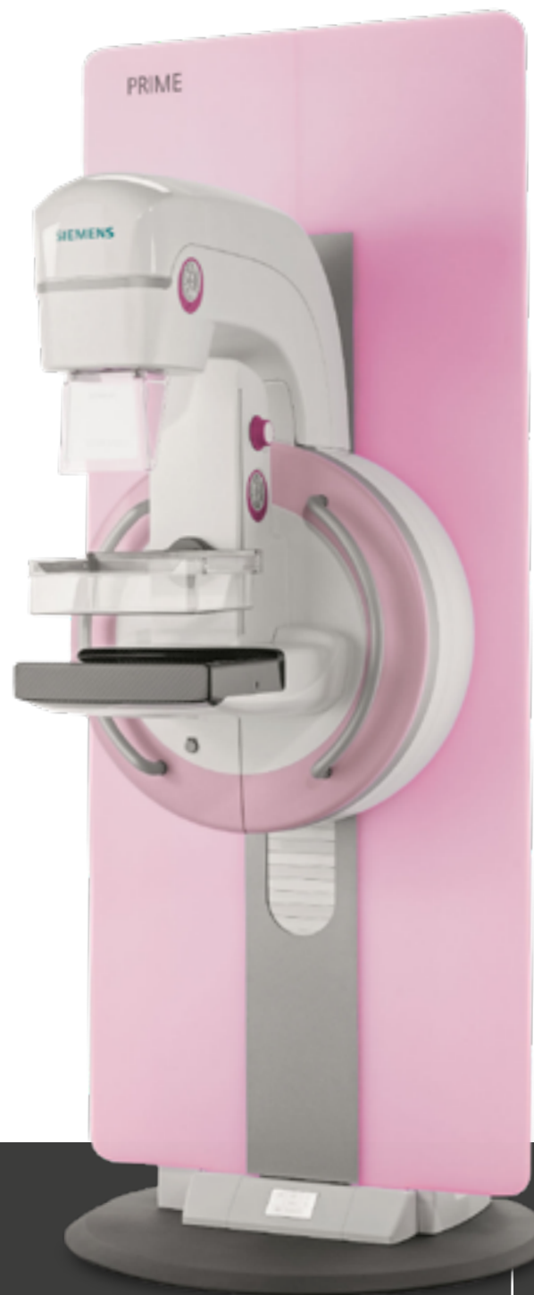
Mammografo Siemens Mammomat tomosintesi apparecchiatura di ultima generazione per la diagnosi precoce del tumore al seno