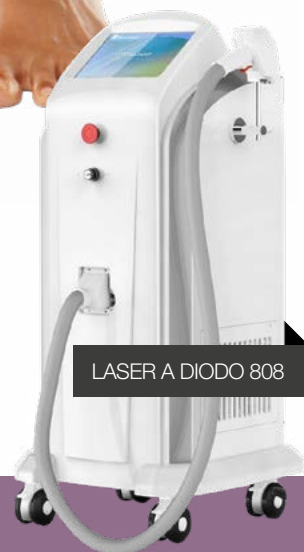
LASER A DIODO 808